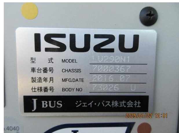
車台番号 7000367 製造年月 2016.07